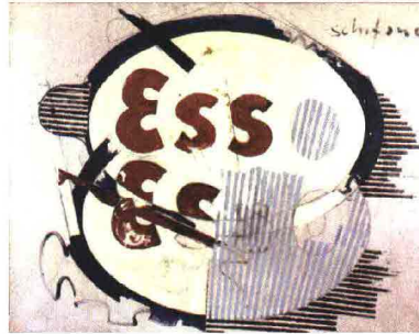
Segno d'Energia (1965) di Mario Schifano.