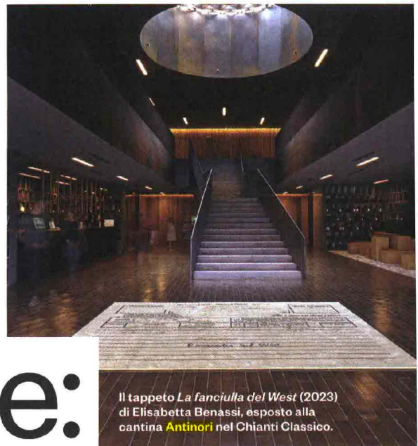
Il tappeto La fanciulla del West (2023) di Elisabetta Benassi, esposto alla cantina Antinori nel Chianti Classico.

LA STANZA DEL VENTO, MERCOLEDÌ-DOMENICA 18-21, FINO AL 31 AGOSTO